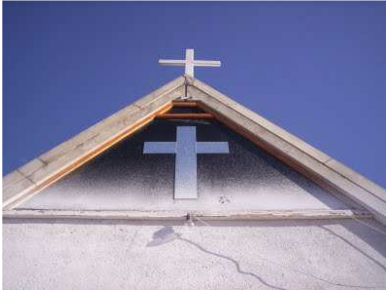
Visita a la Comunidad carismática de Biale Masse, Córdoba.

No toda sanación es milagrosa como creen algunos. San Pablo cuando enumera algunos carismas en la I Carta a los Corintios, cita primero el don de curaciones y a continuación el de operaciones milagrosas (12, 9). No son las personas las que sanan, sólo Jesús sana, pero nos invita a colaborar como instrumento, su poder y amor se canalizan como por un puente. "Solo para Dios todo el honor y la gloria"