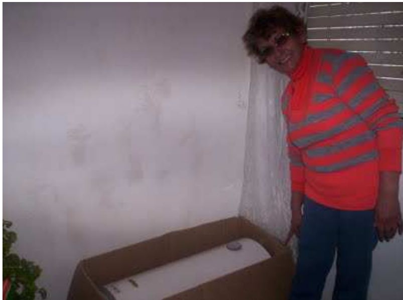
Compartimos la celebración con los hermanos de la Comunidad, que fieles al mensaje de Cristo se juntan para compartir la mesa.